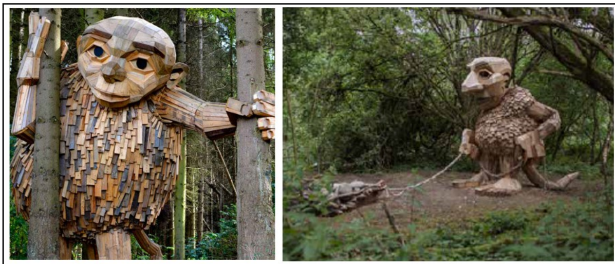
Figur 3: Eksempler på lignende skulpturer af Thomas Dambo.

Eksempler på lignende skulpturer fremgår af billederne nedenfor (figur 3).